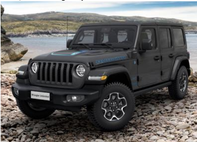
5DM / PDN – Sting-Gray