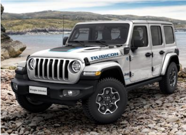
2G1 / 699 – Silver Zynith