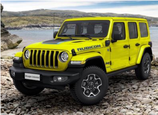
2G2 / 596 – High Velocity