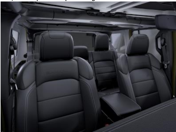
211 / 1CL - Tapiterie din piele cu logo Sahara