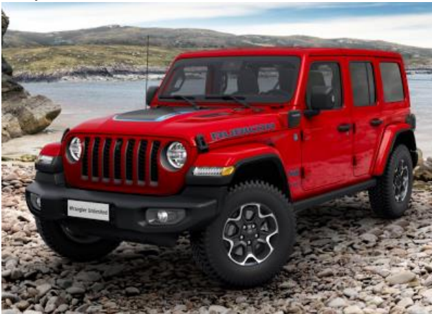
5CB / PRC – Firecracker Red