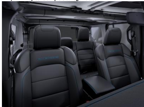
211 / 1AL - Tapiterie din piele cu logo Rubicon