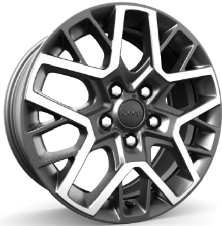
WPR – Jante din aliaj de 18" (standard Sahara)