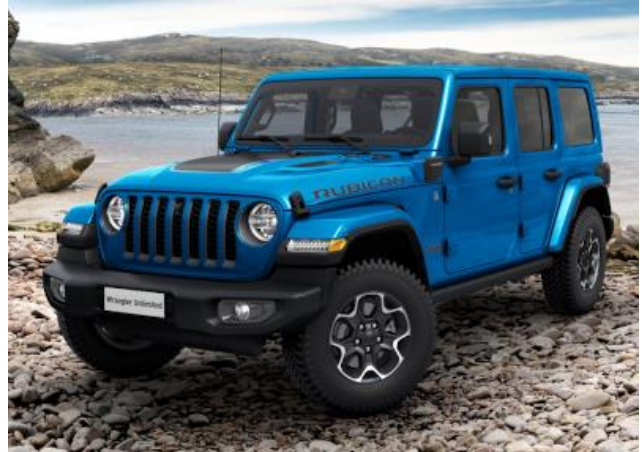
6FW / 858 – Hydro Blue