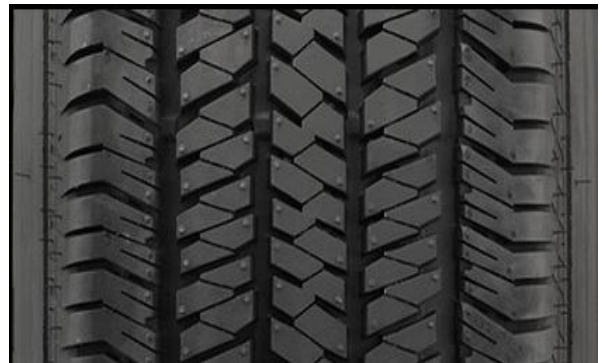
TDA – pneuri all-season 255/70 (standard Sahara)