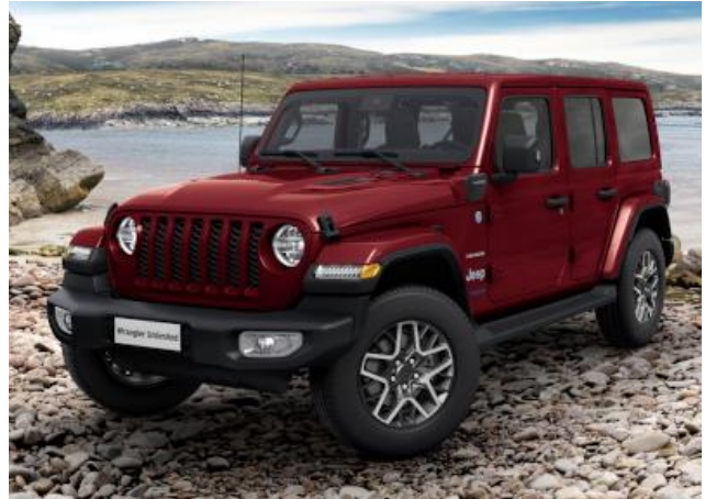
3XU / PRV – Snazzberry