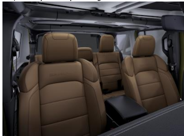
211 / TCV - Tapiterie din piele cu logo Sahara