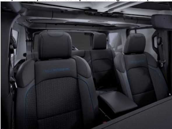
732 / 1D5 - Tapiterie din stofa premium cu logo Rubicon (standard R)