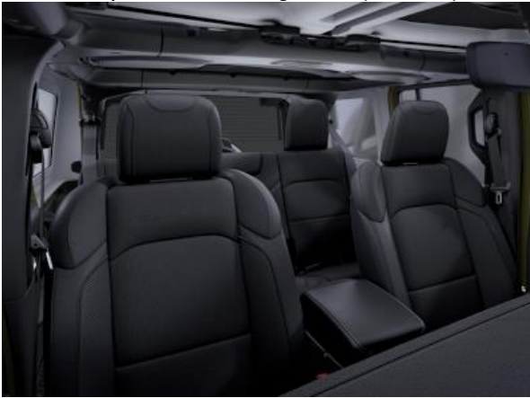
727 / 1T7 - Tapiterie din stofa cu logo Sahara (standard S)