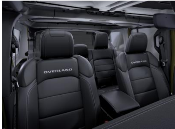
212 / 1ML - Tapiterie din piele premium Mckinley, cu logo Overland