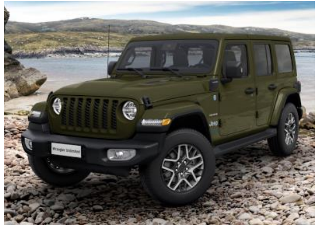
74F / PGG – Sarge Green