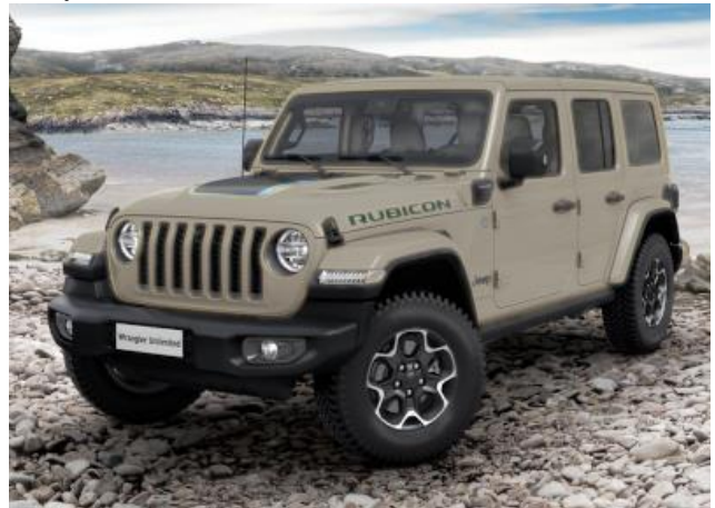
2G3 / 713 – Gobi