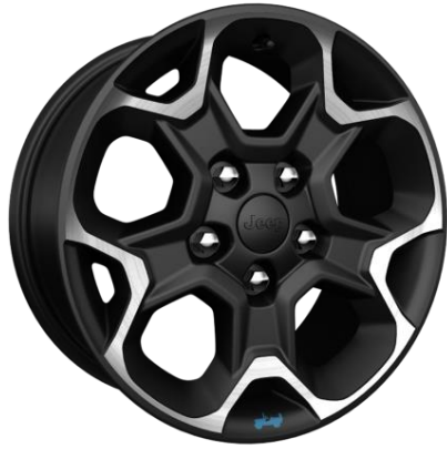
WEF – Jante din aliaj de 17" (standard Rubicon)