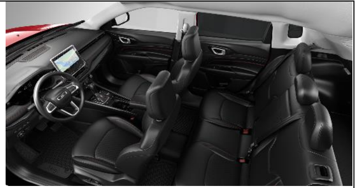
897 - Leather black with red stitching / Trailhawk