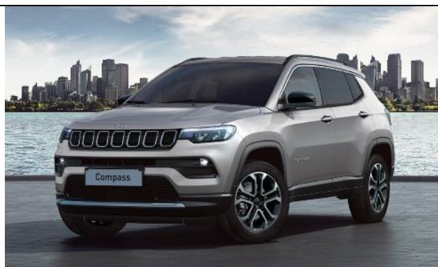
5DN - Vopsea metalizata Glacier