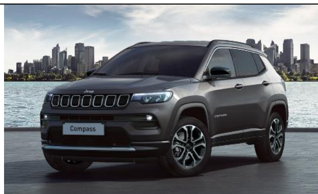
5DT - Vopsea metalizata Graphite Gray