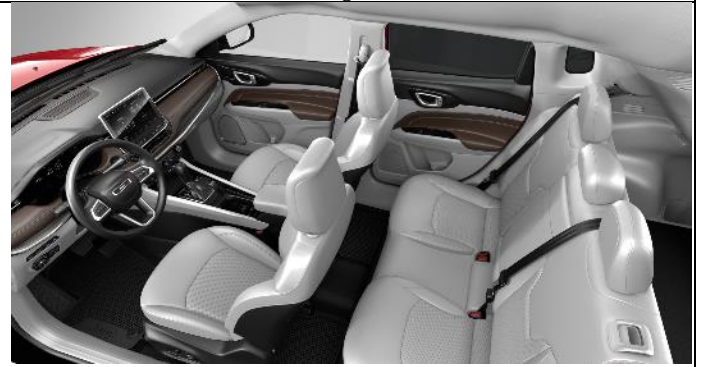
416 - Leather ski grey with diesel grey stitching / Limited