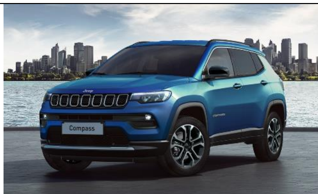
5CH - Vopsea metalizata Blu Italia