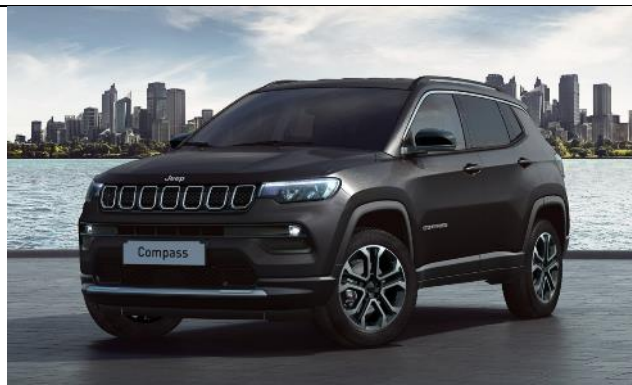
5CE - Vopsea metalizata Carbon Black