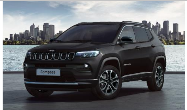
5CK - Vopsea pastel Solid Black