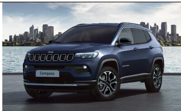
5XZ - Vopsea metalizata Blue Shade