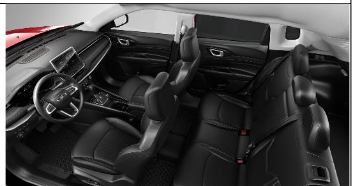
070 - Cloth/ vinyl black with light tungsten stitching / 80 th Anniversary