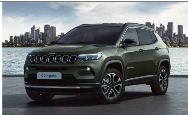
61Q - Vopsea metalizata Techno Green