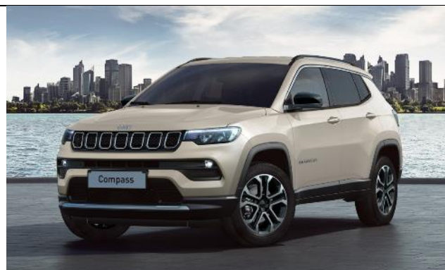
6FX - Vopsea tri-strat Ivory