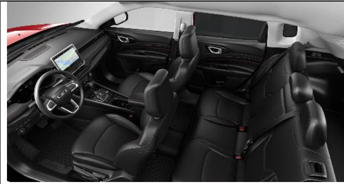
769 - Cloth/Vinyl black with red stitching / Trailhawk