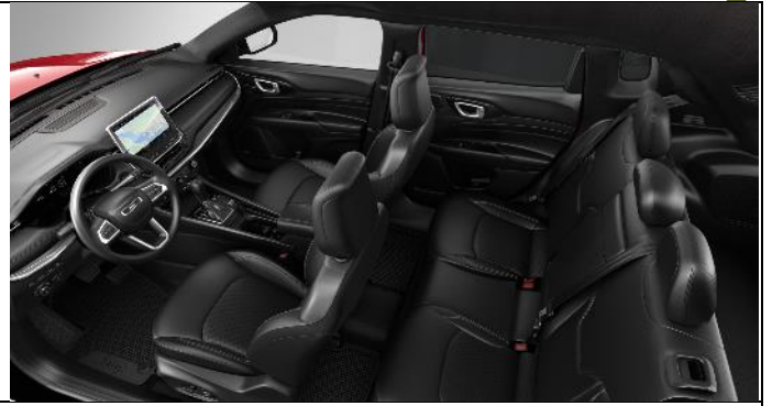
557 - Leather black with diesel grey stitching – ventilated / S