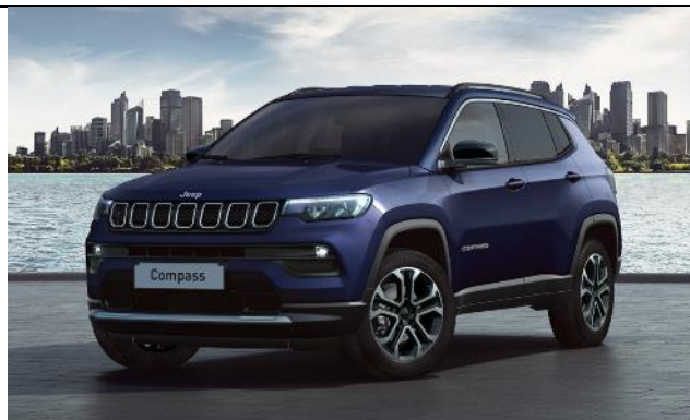
5DP - Vopsea metalizata Jetset Blue