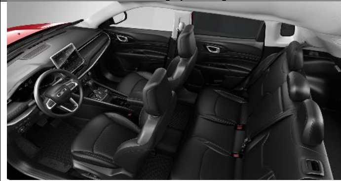
422 - Leather black with diesel grey stitching / Limited