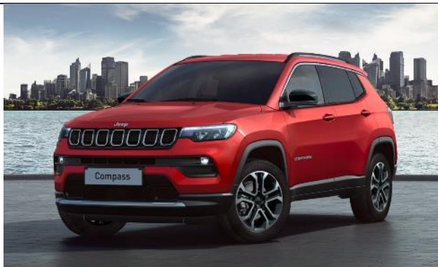
5CJ - Vopsea pastel Colorado Red