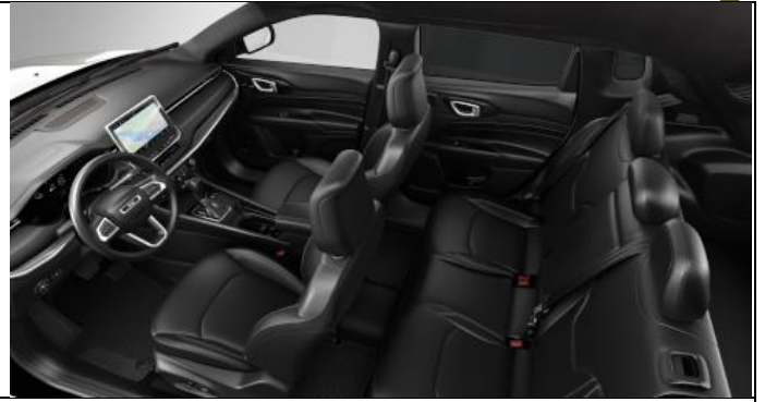
557 - Leather black with diesel grey stitching – ventilated / S