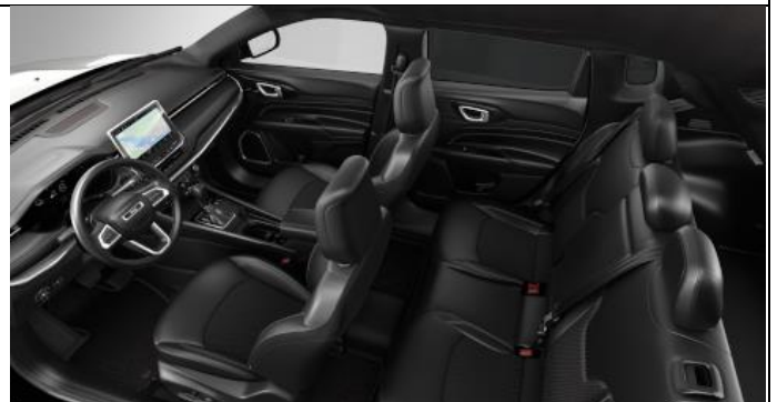
070 - Cloth/ vinyl black with light tungsten stitching / 80 th Anniversary