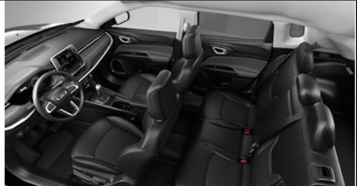
049 - Cloth/ Vinyl black with blue stitching / Longitude