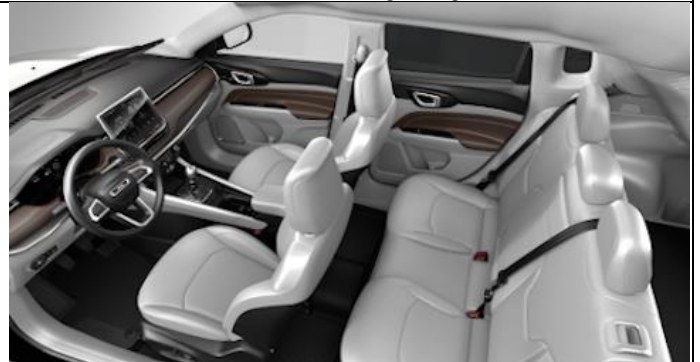
416 - Leather ski grey with diesel grey stitching / Limited