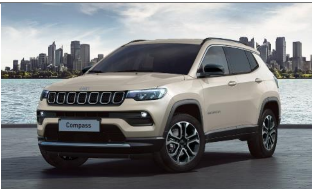
6FX - Vopsea tri-strat Ivory