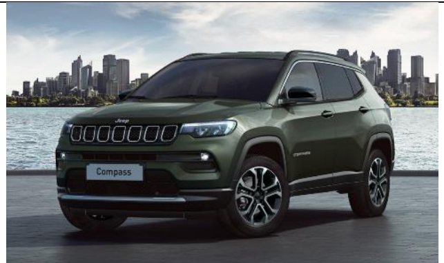
61Q - Vopsea metalizata Techno Green