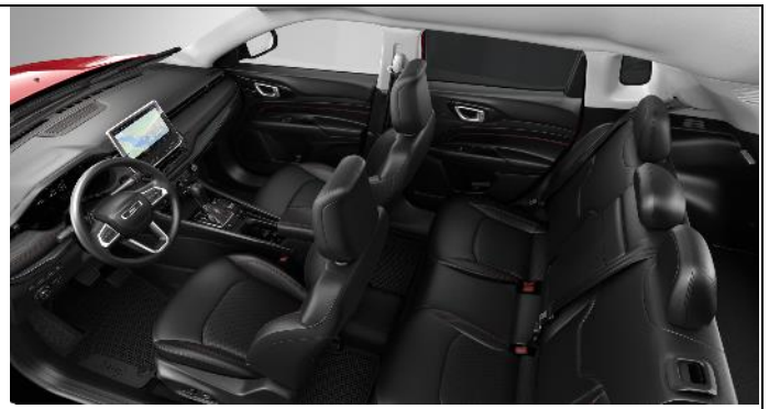
897 - Leather black with red stitching / Trailhawk