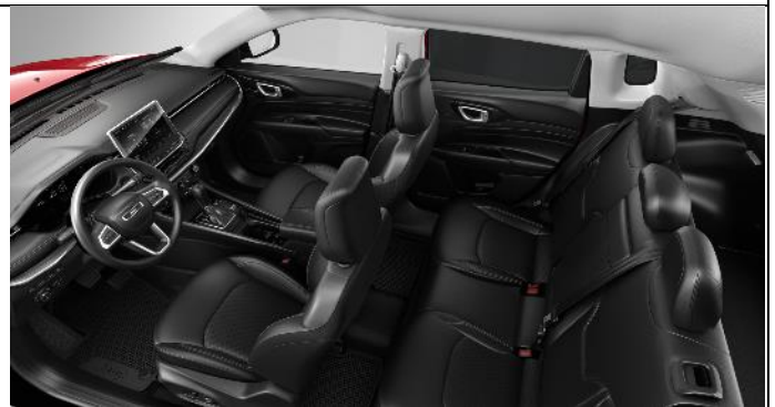
070 - Cloth/ vinyl black with light tungsten stitching / 80 th Anniversary