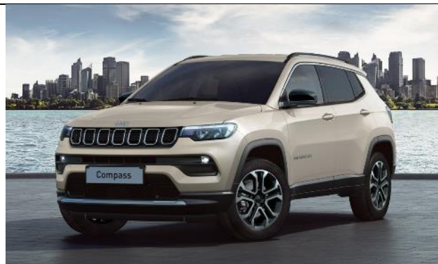
6FX - Vopsea tri-strat Ivory