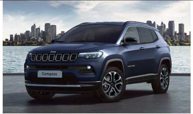
5XZ - Vopsea metalizata Blue Shade