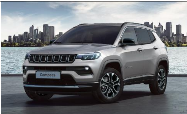
5DN - Vopsea metalizata Glacier