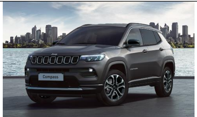
5DT - Vopsea metalizata Graphite Gray