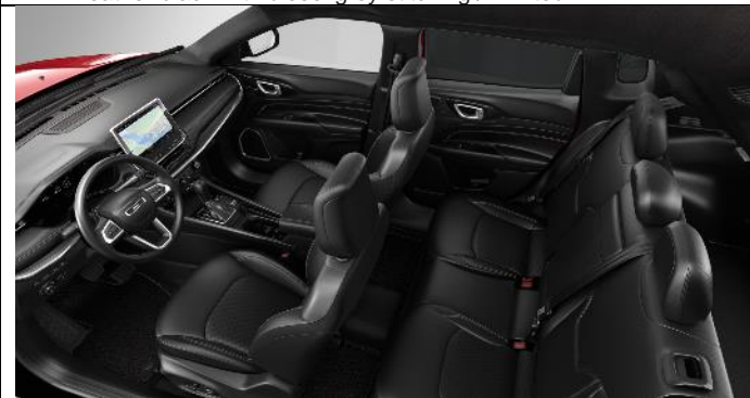
051 - Leather black with light tungsten stitching / 80 th Anniversary