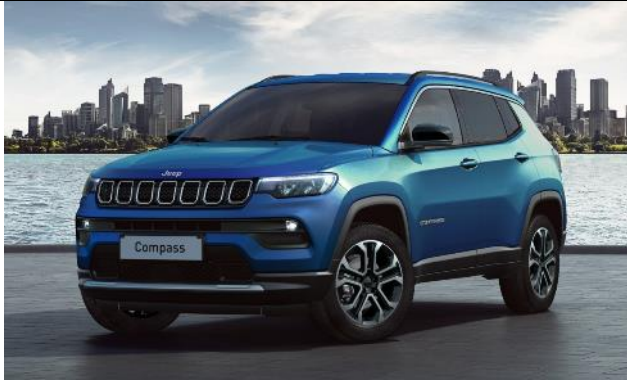
5CH - Vopsea metalizata Blu Italia